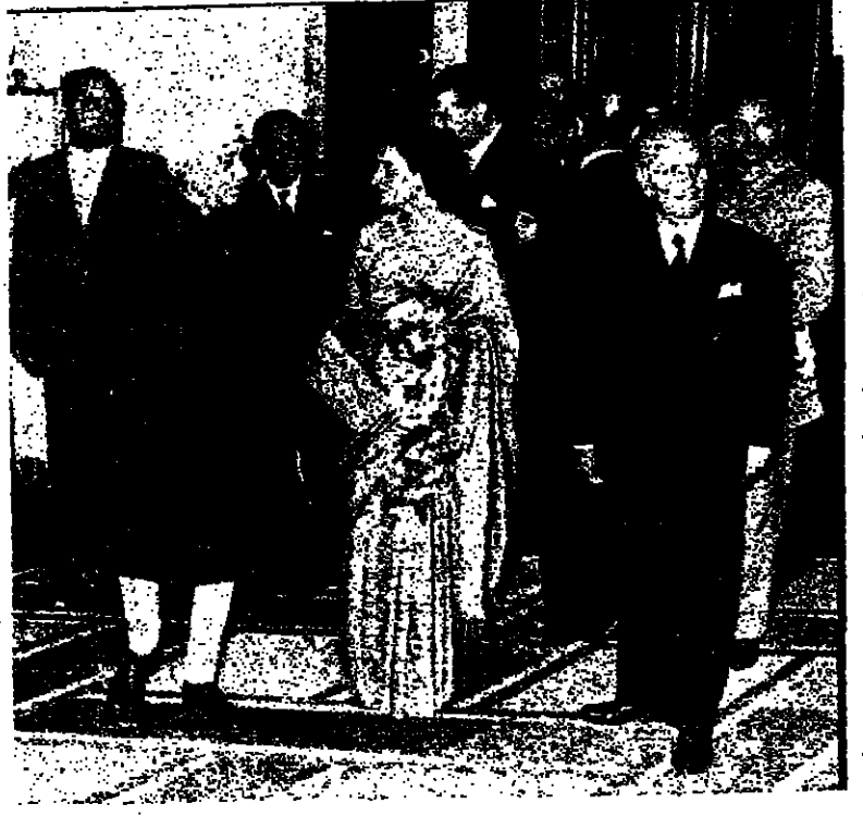
انديرا غاندي وجواهر لال نهرو اثناء زيارتهما بيروت قسي مطلع الستينات .

ولكن نهر لم يبه ذلك الانتقاد ، وكذلك برك غاندي الخطبة ، ويجب الانتباه هنا الى ان فيروز غاندي لا بيت كملها باي نسب . وهكذا عقد تران الثنائي في ربيع سنة ١٩٤٢ وكانت انديرا قد قارت سن الخامسة والعشرين .